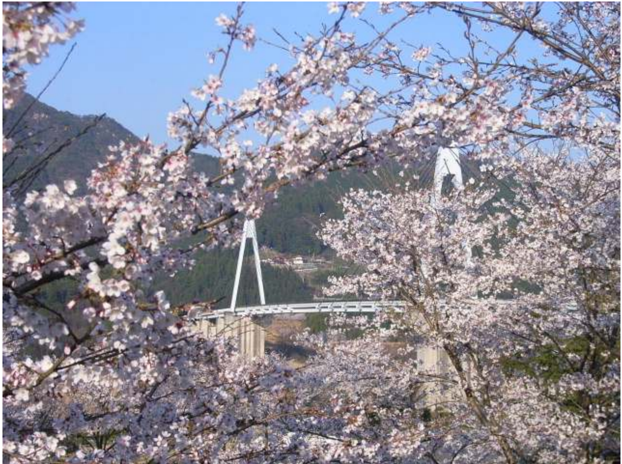
写真：弥栄の大橋と桜

弥栄大橋は、山口県最東部に位置する岩国市美和町と、広島県大竹市との間の弥栄湖（弥栄ダム）上に架かる、美しいダム橋です。全長は560mもあり、西日本最大級ですが、すばらしい自然との調和も楽しむことができます。