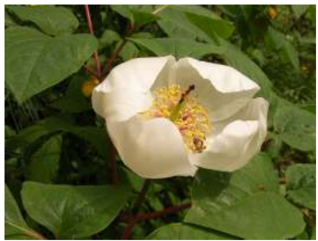
左写真：シャガ（春には山のあちこちに見られます） 右写真：ヤマシャクヤク（尾中先生メモより）